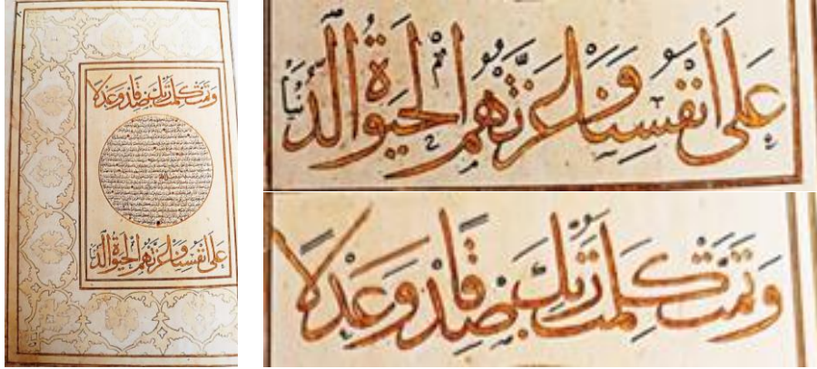
Resim 7: Muhakkak-Nesih Hat ile En'âm Suresi (115-130. âyet-i kerimeler) Kaynak: Serin, 2015 29

En'am-ı Şerif'te bulunan (Resim 7 ve 8) örneklerde de görüldüğü gibi Karahisari bir hattat olmasının yanı sıra bir nakkaş, bir grafik tasarımcı gibi orijinal kompozisyonlar oluşturmuş ve tahrirlediği yazılarla fevkalade bir güzellik ortaya koymuştur.