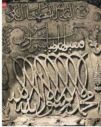
Resim 1: Uşşâkî Camii Çeşme Yazısı

Kaynak: (Fotoğraf: Baha Gelenbevi, Hayat Mecmuası) alıntılayan Ünal, 2020