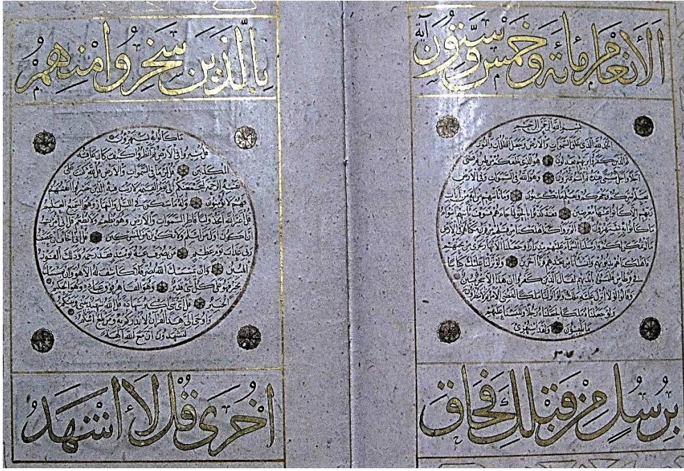
Resim 8: Sülüs ve Nesih Hatla “El-en‘âm mie ve hamse ve sittün.” (En‘âm suresi 1-19. âyet-i kerîmeler) Kaynak: Çevik, 2011