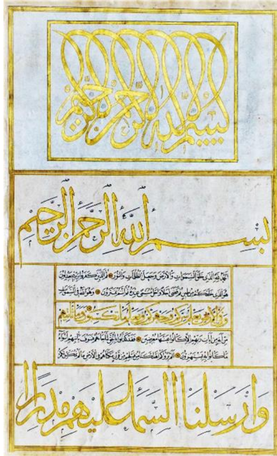
Resim 5: En'am-ı Şerif, (TİEM 1443)

(Resim 5). Her iki istifin ilk ve son harfinin yukarı uzantıları bir miktar uzun tutularak tasarımda ritim sağlanmıştır. Kalem hiç kaldırılmadan yazılan harflerin birbirinin altından, üstünden geçerek oluşturduğu kompozisyon yazıya boyut kazandırmıştır 26 .