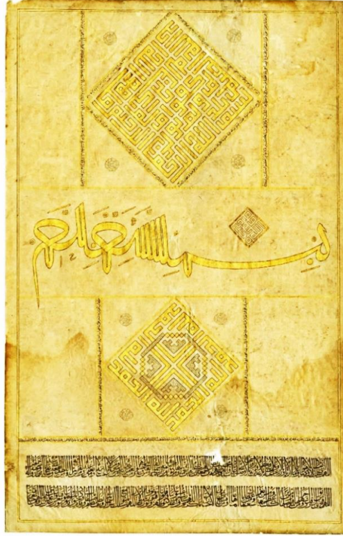
Resim 6: Müselsel Besmele (Kerem Kıyak Özel Koleksiyon) Kaynak: Çelik, 2015 28

i celile yer almaktadır. Altta satrançlı Kûfi hat ile “elhamdülillâh” görülmektedir (Resim 6). Altınla yazılmış olan ve siyahla tahrirlenen kompozisyon göz kamaştırıcıdır.