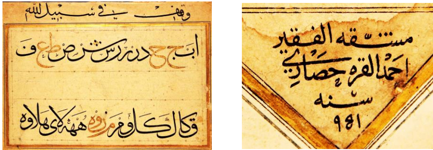
Resim 11: Meşik-i hurûfât (Kütahya Vahit Paşa Yazma Eser Kütüphanesi)

Afyonkarahisar Müzesi kayıtlarına göre 1949 yılında müzeye kazandırılan Karahisari'nin meşikleri, 2018 yılında Kütahya Vahit Paşa Yazma Eser Kütüphanesine gönderilmiştir. Karahisari'nin bazı eserlerinde uyguladığı tahrirli harflerin meşiklerinde de yer aldığı görülür (Resim 11).