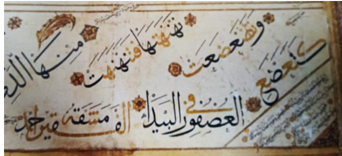
Resim 9: Sülüs, Muhakkak, Nesih Kıt'a (Süleymaniye Ktp. 15-2)

Karahisari'nin kıtaları da vardır (Resim 9). Karahisari, bu kompozisyonda önceki örneklerden farklı olarak bir harf siyah bir harf tahrirli altın, bazen de aynı harfin yarısını siyah, yarısını tahrirli altın yazarak farklı bir tasarım oluşturmuştur. Karahisari, bu tasarımı sadece estetik tercihlerle mi yapmıştır, yoksa anlatmak istediği aslında estetik tercihlerin ötesinde başka bir ifade midir, bugün için bilinmiyor. Karahisari'nin tahrirli yazıları dikkate alındığında anlatmak istediği ne olursa olsun, yazıdaki görsel ihtişamın varlığı şüphe götürmez bir gerçektir.