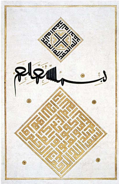
Resim 2: Satrançlı Kûfi ve Müselsel Besmele Tasarım (TİEM, 1443)

Ahmed Şemseddin Karahisari'nin yazıda ortaya koyduğu eşsiz bir başka güzellik de harflerin etrafına tahrirler çekmesidir.