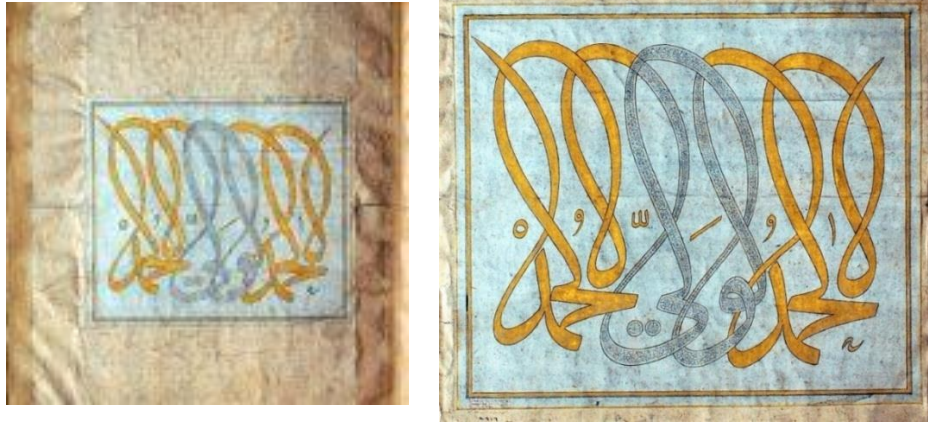
Resim 4: Müselsel Kompozisyon, (TİEM 1443)

Ahmed Şemseddin Karahisârî'nin (TİEM, nr. 1443) de (Resim 2) yer alan kompozisyonunda üstte diagonal kare formda kûfî hat ile “elhamdülillâh”, ortada müselsel hat ile besmele-i celîle, altta ise İhlâs suresi diagonal kare formda Kûfî hat ile yazılmıştır. Resim 3'te yer alan En'am-1 Şerif kompozisyonunun ortasındaki celi sülüs yazıda ve diagonal kare formda tasarlanan (Resim 2) Kûfî hatta altınla yazılan harflerin etrafına koyu renkte tahrir çekilmiştir.