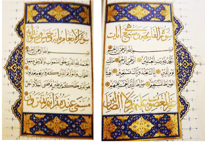
Resim 10: Kur'an Cüzü (1554-TSM, E.H.416)

Afyonkarahisar Müzesi kayıtlarına göre 1949 yılında müzeye kazandırılan Karahisari'nin meşikleri, 2018 yılında Kütahya Vahit Paşa Yazma Eser Kütüphanesine gönderilmiştir. Karahisari'nin bazı eserlerinde uyguladığı tahrirli harflerin meşiklerinde de yer aldığı görülür (Resim 11).